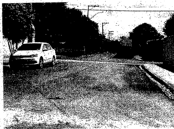
Rua Luis Bocardin