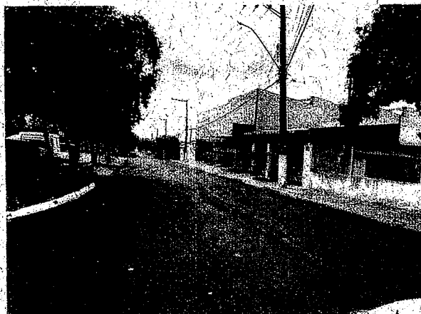
Rua Ver. José Ricardo Pelizer