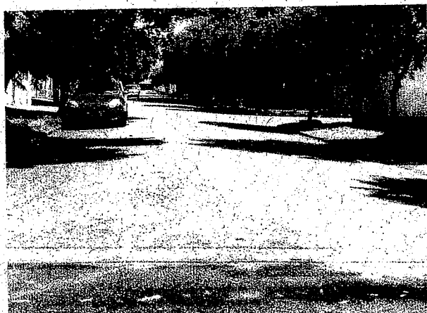
Rua Carolina Pereira Alves