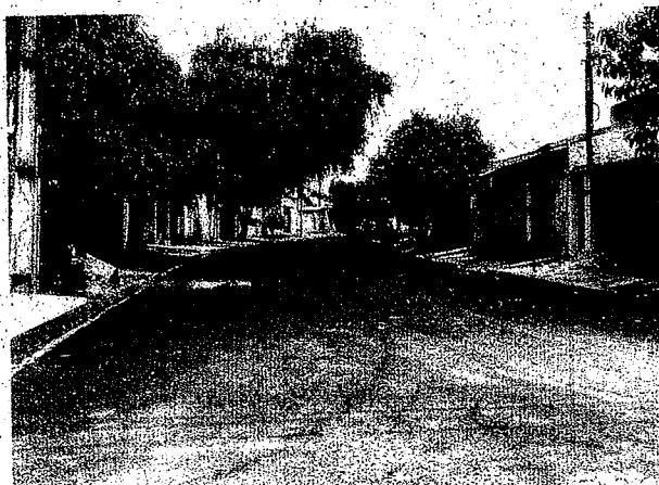
Rua campos Sales