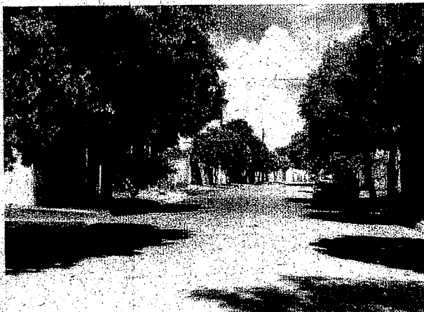
Rua Candido Portinari