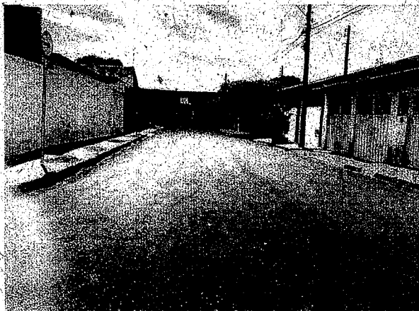
Rua Zeca Jorge