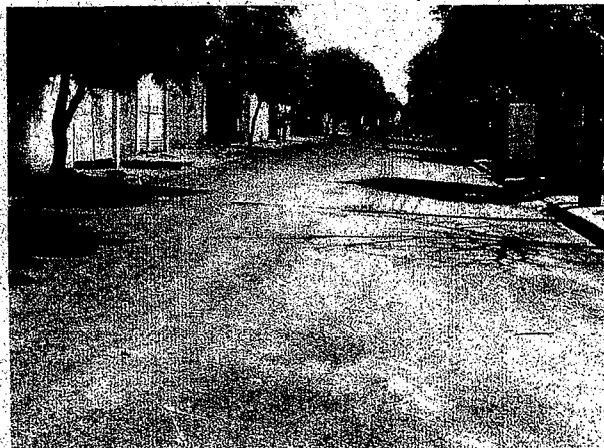
Rua Rua Oldack Noya