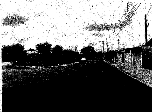
Rua Salim Salum