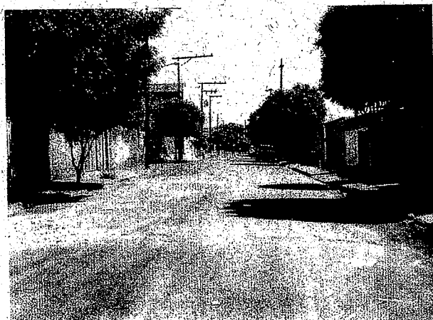
Rua Antonio Costa