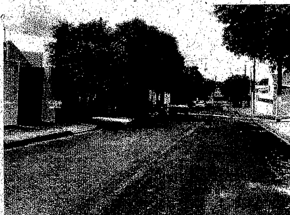
Rua Thomas Pereira Alvim