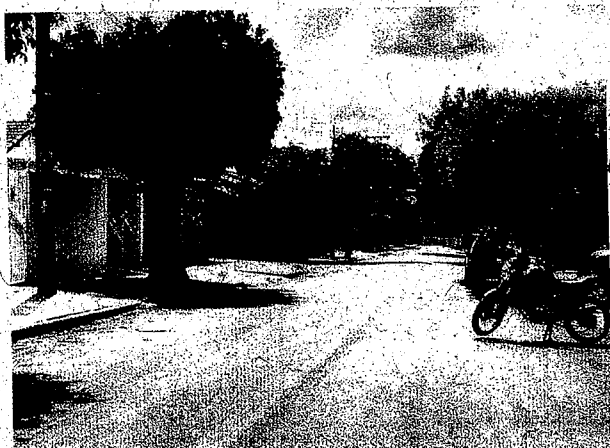
Rua Prof. Saturnino G. da Cruz