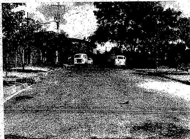
Rua Pres. Café Filho