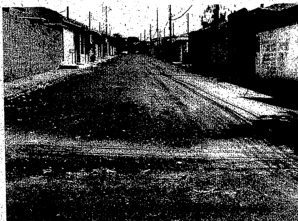
Rua Sebastião R. Nogueira