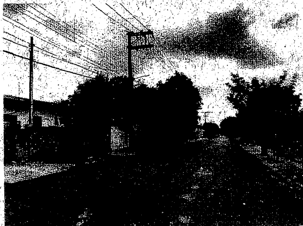
Rua João Lopes

LOCAIS: RUAS URBANAS DA CIDADE E DISTRITOS - PARAGUAÇU PAULISTA – SP