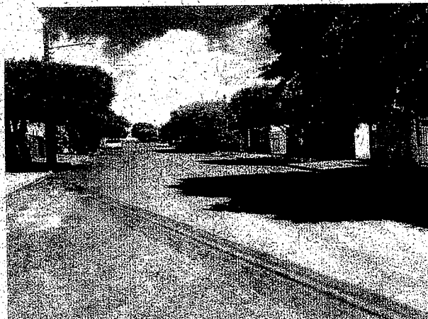
Rua Assis Chateaubriand