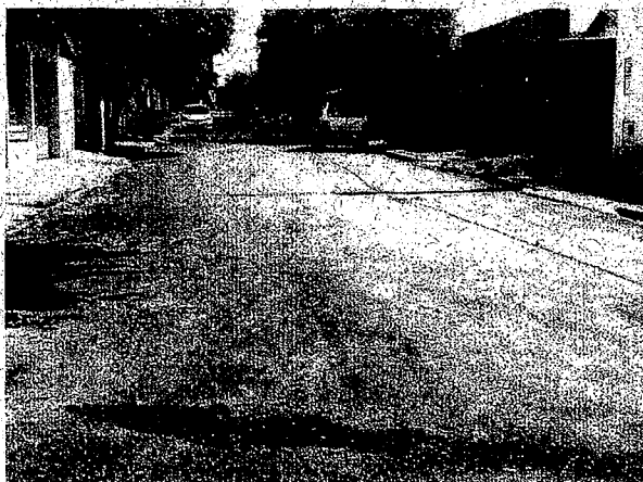
Rua Rio Grande do Sul