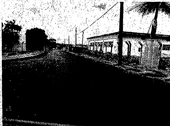
Rua Pres. Café Filho