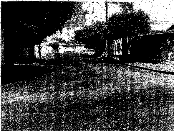
Rua Ruth Deliberador