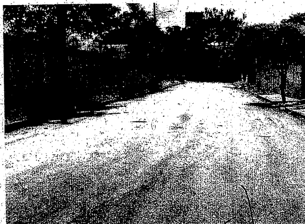
Rua Oracy Brochado