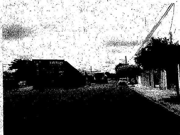
Rua André Vicente de Campos