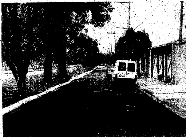
Rua Sete de setembro