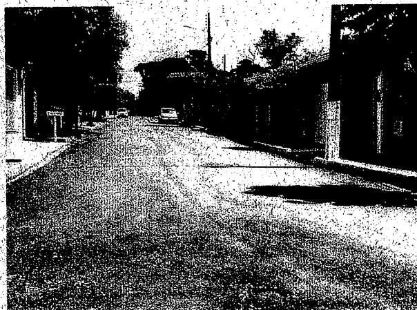
Rua Ver. Vail J. de Toledo