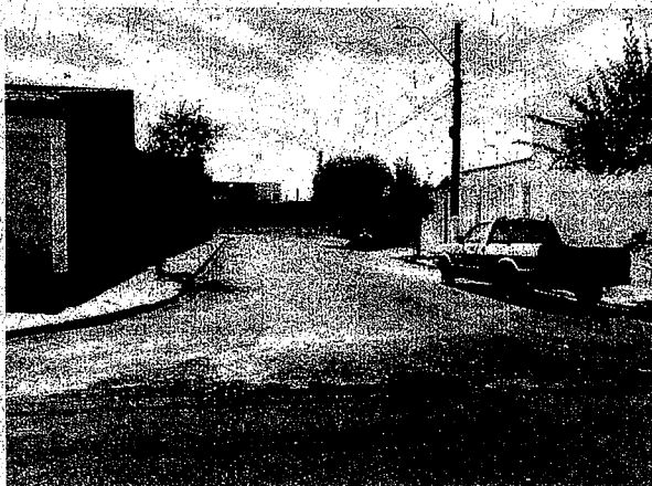
Rua Olavo Oliveira

Paraguaçu Paulista, em 13 de novembro de 2019.