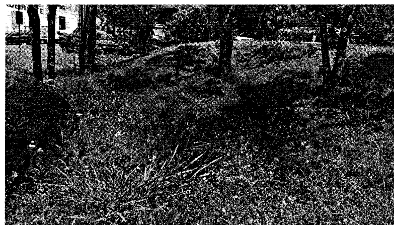
Jardim das Cerejeiras