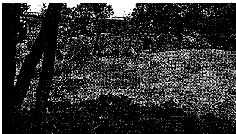
Jardim das Cerejeiras