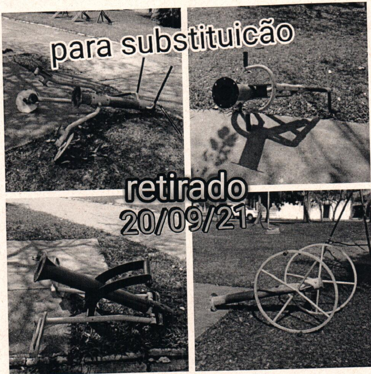
Aparelhos de ginástica em péssimo estado de conservação

Paraguaçu Paulista 20 de Setembro de 2021