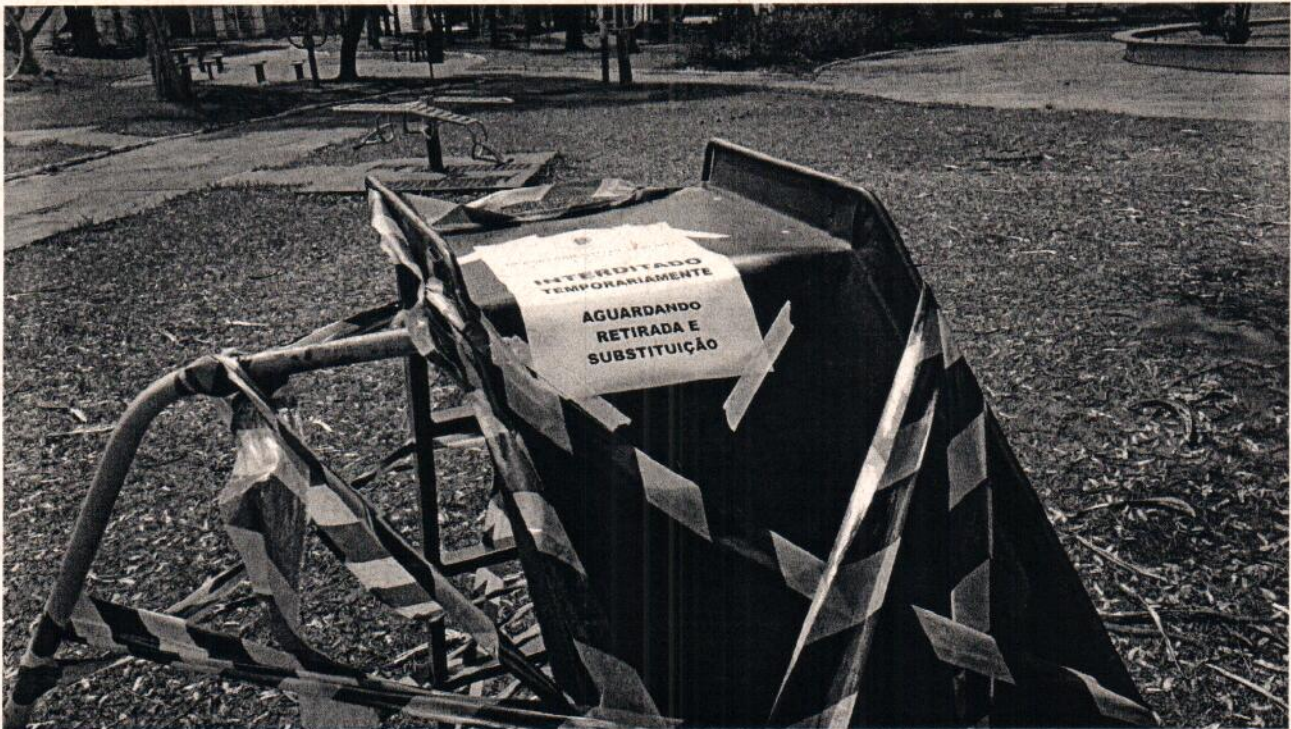
Escorregador com pontas soltas e enferrujados