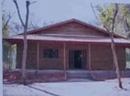
Centro de Referência da Educação Ambiental de Paraguaçu Paulista